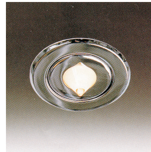
DALI 1616xx + 401900